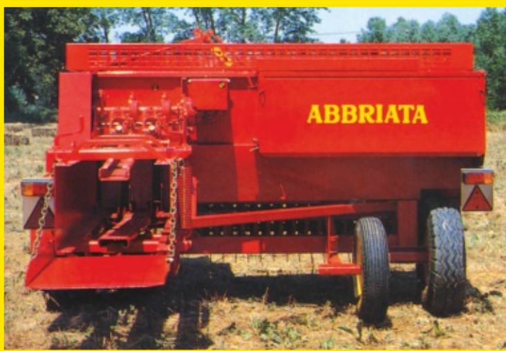
Vista posteriore con III ruota montata Rear view with third wheel mounted