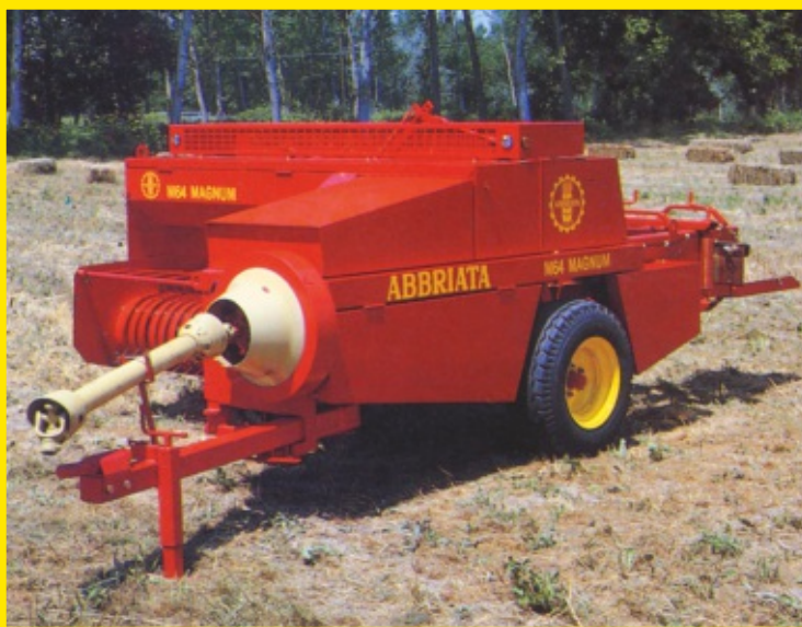
Vista generale General view